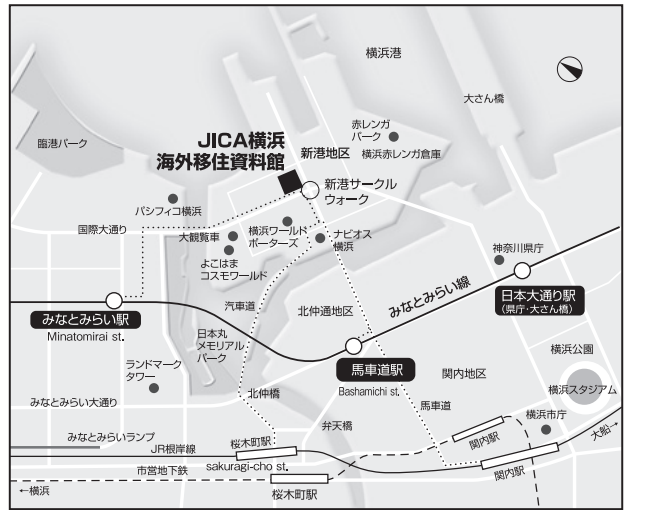
JICA横浜海外移住資料館(赤レンガ国際館)付近案内図

*横 浜 駅 市営バス8, 20, 58, 110, 127系統、本町4丁目下車、ワールドポーターズ方向に徒歩8分。 *100円バス：土日祝日、夏休み、冬休み、春休みのみ運行。横浜駅または桜木町駅から赤レンガ倉庫行き100円バスでワールドポーターズ下車、サークルウォークを通り徒歩3分 *自 動 車：首都高速神奈川線みなとみらいICから5分